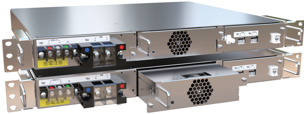
*画像は2台のイメージです。 *並列運転はできません。