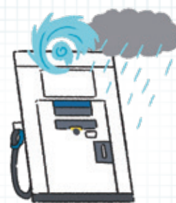
台風などによる浸水